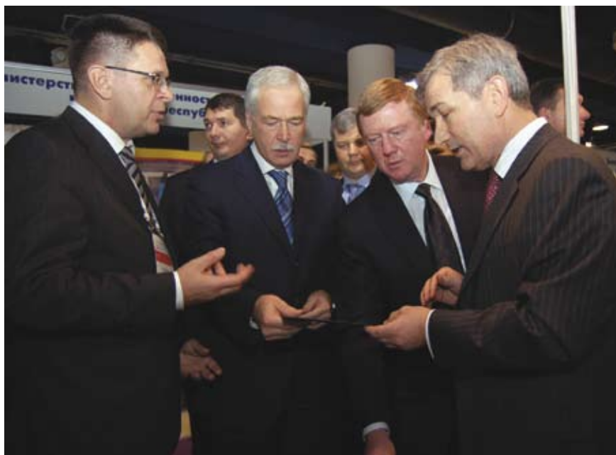
► Визит председателя Государственной думы Российской Федерации Б. В. Грызлова и генерального директора ГК «РоснаноТех» А. Б. Чубайса на стенд НПО «Унихимтек» на международном форуме «Нанотехнологии-2008»

Мы хорошо понимаем, что нельзя останавливаться на достигнутом, и продолжаем фундаментальные исследования в области