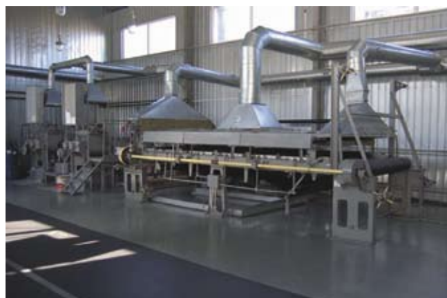
➤ Рис. 2. Цех по производству огнезащитных материалов

коэффициент полезного действия установок, существенно снизило величину вредных выбросов и трудоемкость ремонта. Более того, появилась возможность исключить использование канцерогенных асбестовых материалов, за-