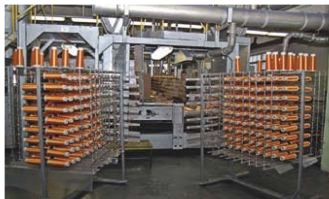
➤ Рис. 1. Цех по производству графитовой фольги