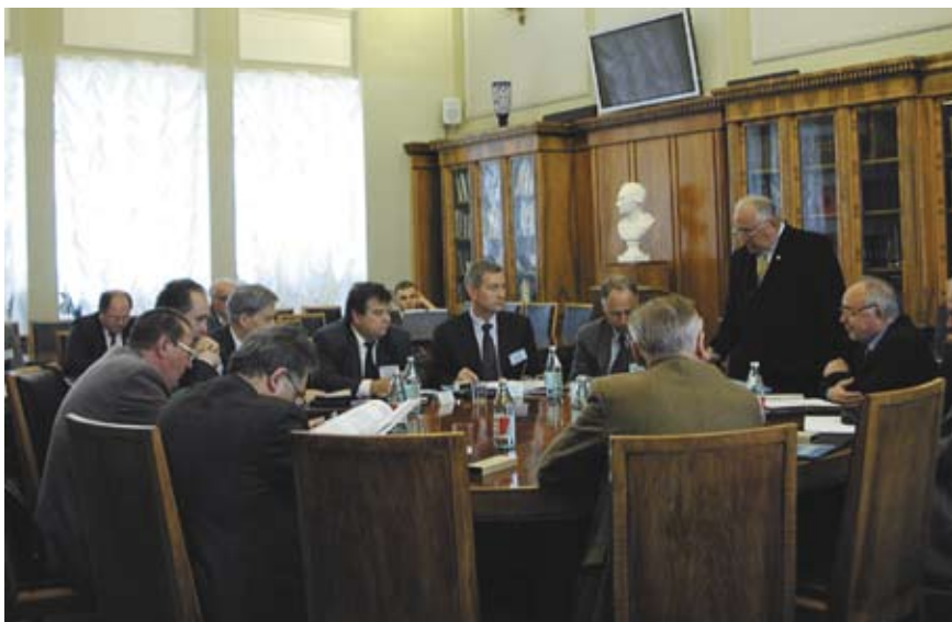
➤ Заседание Наблюдательного Совета ИНУМИТ 23 июня 2003 г.

современного материаловедения. Для развития новых направлений инновационного бизнеса в области материалов, создания научной и сертификационной базы организации производств новых видов продукции, ЗАО «Унихимтек» с участием МГУ им. Ломоносова, Фонда содействия развитию малых форм предприятий в научно-технической сфере и Российским фондом технологического развития учрежден Институт новых углеродных материалов и технологий (ИНУМИТ), лаборатории которого оснащены самым современным исследовательским и сертификационным оборудованием.